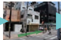
信号のある交差点の角に添って左手に曲がってください。