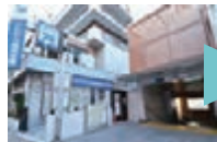
東西線「神楽坂駅」神楽坂口から外へ出ます。「ポイント1」