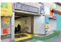
都営大江戸線「牛込柳町駅」下車、東口から外へ出ます。