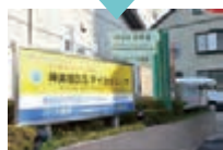
クリニックの手前は、上り坂です。坂の頂上付近まで進むとクリニックの看板が左に見えます。