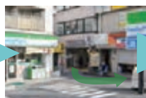
東口から出ると正面にファミリーマートがあります。左に進み大久保通りに出るので、左（東方向）に曲がってまっすぐ進んで下さい。