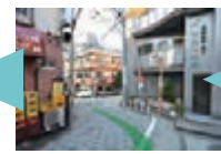
「ポイント4」突き当たりを左に進むとすぐに別れ道です。