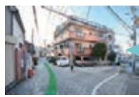
「ポイント5」左に進みます。ここを過ぎるとまっすぐです。