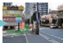
大久保通りに沿って東に進んで下さい。