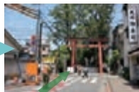
赤城神社の看板があり、進行方向には鳥居が見えます。