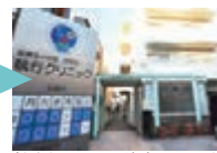
神楽坂駅から、徒歩5分ほどでクリニックに着きます。

執行クリニックへのアクセスルートです。「ポイント2」と「ポイント4」で間違われることが多いようです。迷われたり、不安な時は遠慮無くお電話ください。