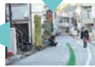
「ポイント3」から「ポイント4」下り坂が続きます。