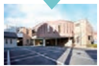
牛込柳町駅からですと、徒歩で5分ほどでクリニックに着きます。