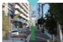
市谷柳町の交差点から東に進みます。