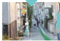
「ポイント5」クリニックの看板が見えて参りました。